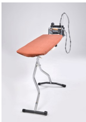
Bügelchamp KETTLER Professional