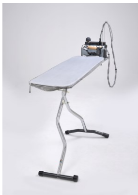
Bügelcenter KETTLER 2000

Mabipress Pro2 (L31 x B27,7 cm) ist 100% kompatibel zu allen Kettler und Mabi Bügeltischen. Die 160 cm lange Schlauchführung gewährleistet eine Nutzung mit den meisten handels-üblichen Bügeltischen.