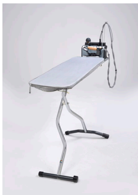
Bügelcenter KETTLER 2000

Mabipress Pro2 (L31 x B27,7 cm) ist 100% kompatibel zu allen Kettler und Mabi Bügeltischen. Die 160 cm lange Schlauchführung gewährleistet eine Nutzung mit den meisten handels-üblichen Bügeltischen.