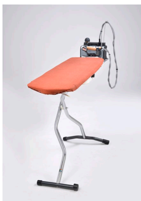
Bügelchamp KETTLER Professional